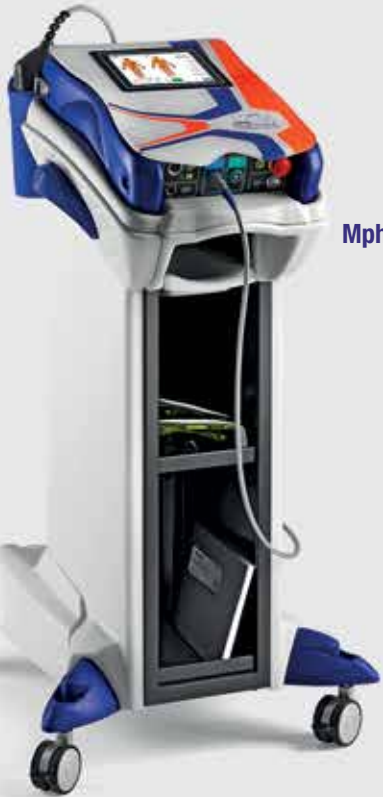
Mphi 75 Trolley